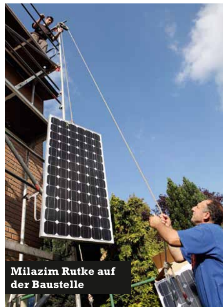
Milazim Rutke auf der Baustelle