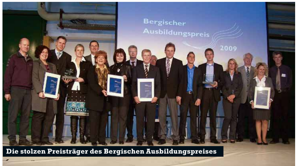
Die stolzen Preisträger des Bergischen Ausbildungspreises

Dass die Region über viele ungewöhnliche Veranstaltungsorte verfügt, ist bekannt. Der Ort, den die Wirtschaftsförderung Wuppertal für die Verleihung des diesjährigen Bergischen Ausbildungspreis gewählt hatte, fiel besonders auf: Eine ehemalige Produktionshalle im Gewerbepark A46.